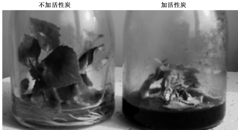
图 1 活性炭对京 2 杨组培苗生长的影响