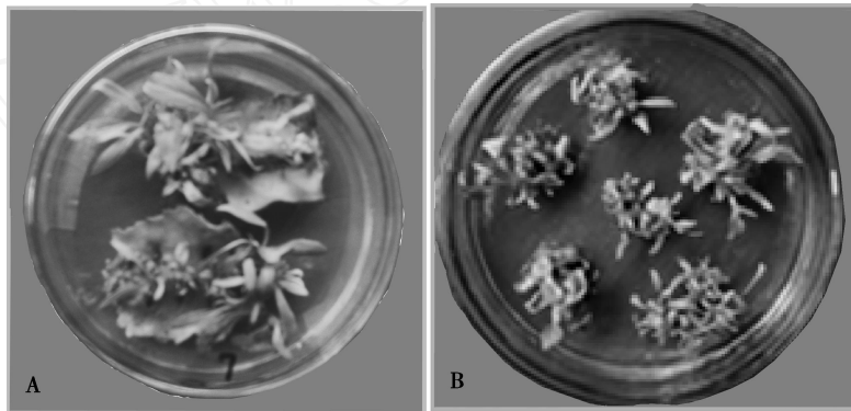
图 3 京 2 杨不定芽的分化情况

A: 京 2 杨无菌苗叶片在 BA/NAA 组合处理 6 中的分化情况 B: 京 2 杨叶柄在 BA/NAA 组合处理 9 中的分化情况